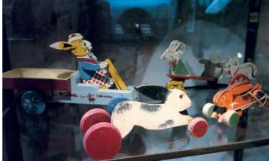
Nines de porcellana, cavalls de fusta i de cartró, avions, trens, cotxes, bicicletes, tractors, animallets, futbolins... i tota mena de col·leccions relacionades amb el món infantil.