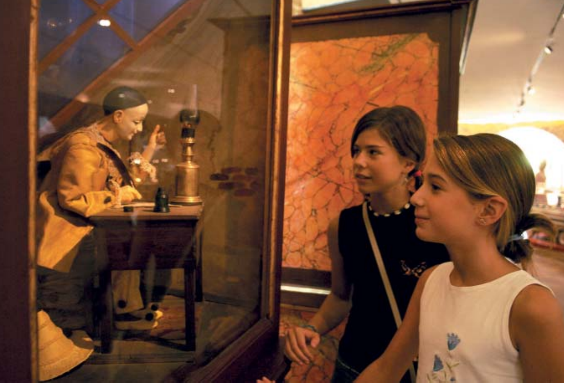
Els diumenges al migdia, puntualment i tots alhora, es posen en marxa els 24 autòmats del museu, una col·lecció que deixa bocabadat tothom.

L'edifici del museu, situat a la Plaça Major del poble, destaca per les seves dimensions: de fet, abasta l'espai que ocupaven quatre cases, entre les quals l'antiga casa pairal de Can Jan. El museu consta de quatre plantes i té una superfície global de 2.000 m 2 . Però no es tracta solament de quantitat: la construcció, remodelada pels arquitectes Daniel Gelabert i Armand Solà, presenta unes formes noves i amb un cert regust gaudinià que, ja d'entrada, no deixa indiferent el visitant.