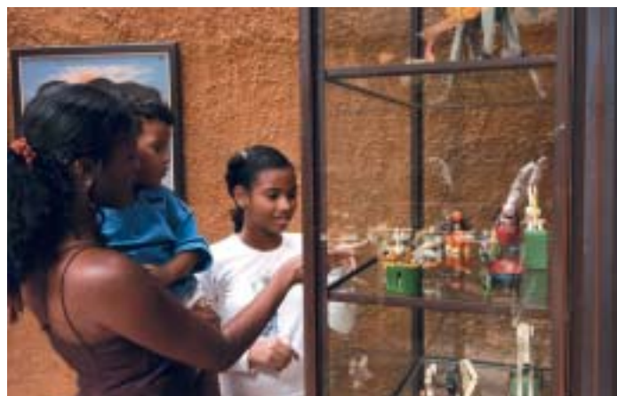
L'originalitat caracteritza l'edifici que acull el museu, amb quatre plantes i 2.000 m 2 de superfície plens de joguines i records d'infantesa.